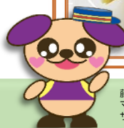
藤沢市保健医療財団 マスコットキャラクター サボ犬